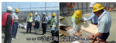
=== 金沢海上調査 ===

7月24日、金沢、富山方面3箇所、金沢海上調査、法島町、氷見坂津の鉄筋挿入の安全パトロール。