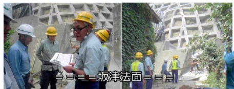
=== 坂津法面 ===

この日の気温も33℃、保冷ベストを着用するなどの対策はしていますが、法面からの照り返しで厳しい現場。冷房を完備した詰所の要請がありました。