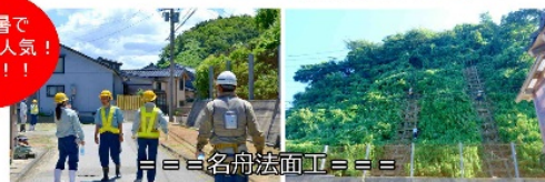
=== 名舟法面工 ===