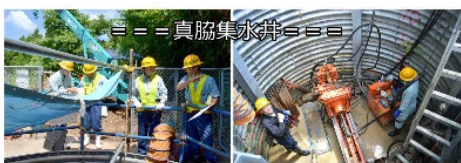
=== 真脇集水弁 ===

7月23日、能登方面2箇所、真脇集水ボーリング現場と名舟の法面除草作業現場の安全パトロール。真脇は仮設状況、安全表示板などがすばらしく、熱中症対策も考えてありました。名舟では、法面か？と思うほどの、つる草やイバラで覆われた法面で、大変な現場でした。