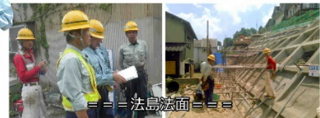
=== 法島法面 ===

7月24日、金沢、富山方面3箇所、金沢海上調査、法島町、氷見坂津の鉄筋挿入の安全パトロール。